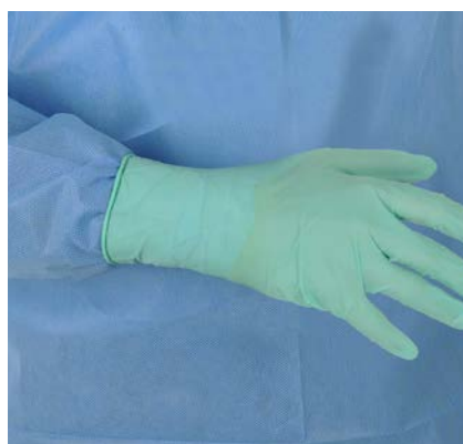
Bonne protection du poignet / Well protected wrist