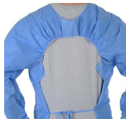
Elastique dorsal resserrant / Elastic tightening