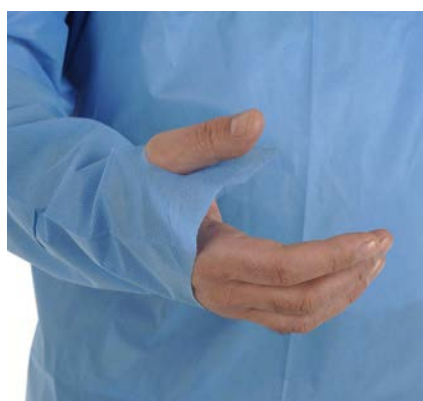
Passer pousse / Thumb pass